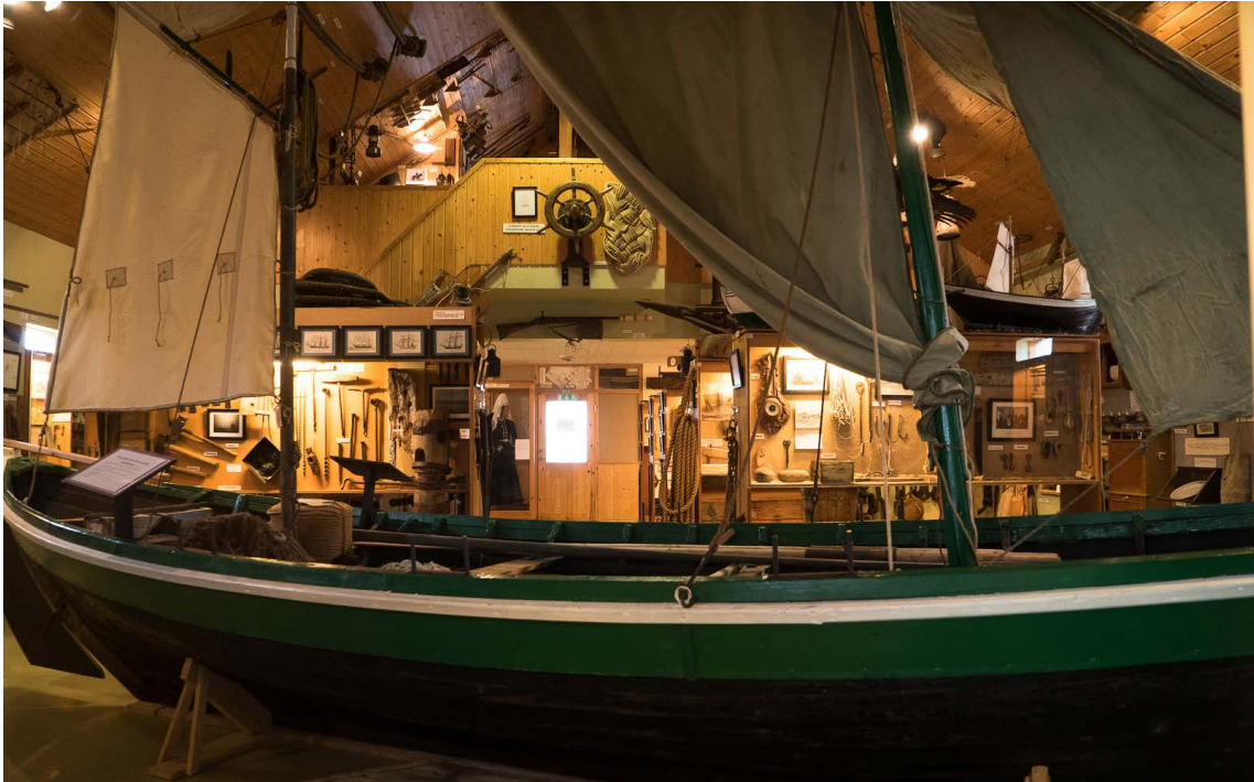
Minjasafn Egils Ólafssonar að Hnjóti í Örlygshöfn