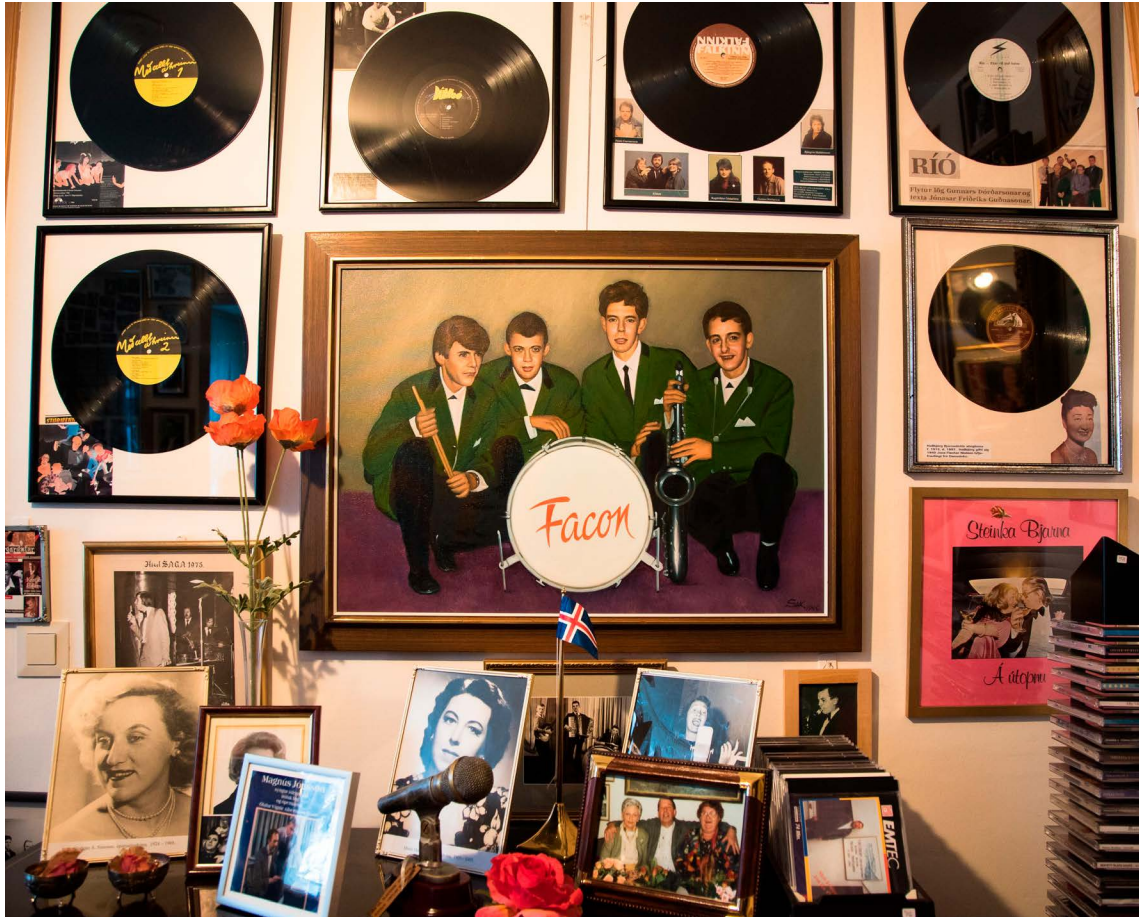
Melódiur minninganna á Bíldudal

að sérstakt hús sem standist öll mál verði hannað og reist frá grunni. Vitaskuld má hugsa sér að breyta byggingu sem þegar er risin, en hætt er við því að kostnaður verði ekki minni en við nýbyggingu. Slíka byggingu má hugsa í tengslum við mögulegt ábyrgðarsafn og getur það um leið orðið vettvangur fyrir starfsfræðslu og námskeiðahald. Þar getur verið búnaður til forvörslu og ljósmyndunar safngripa. Byggingin getur orðið miðstöð safnastarfs í fjórðungnum og eftl samtál og samstarf safnafólks verulega. Við val á staðsetningu ætti að taka mið af spám um framtíðaráhrif loftlagsbreytinga m.a. aukin tíðni og kraftur sjávarflóða, ofanflóða og úrkomu.