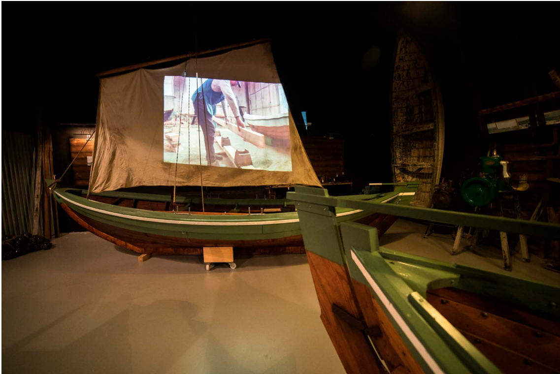
Báta- og hlunnindasýningin á Reykhólum