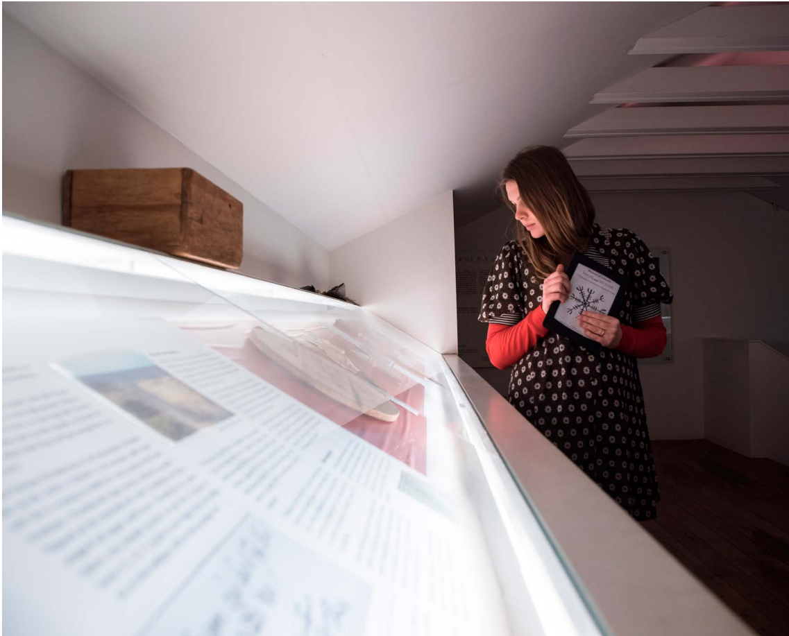
Galdrasýningin á Hólmavík