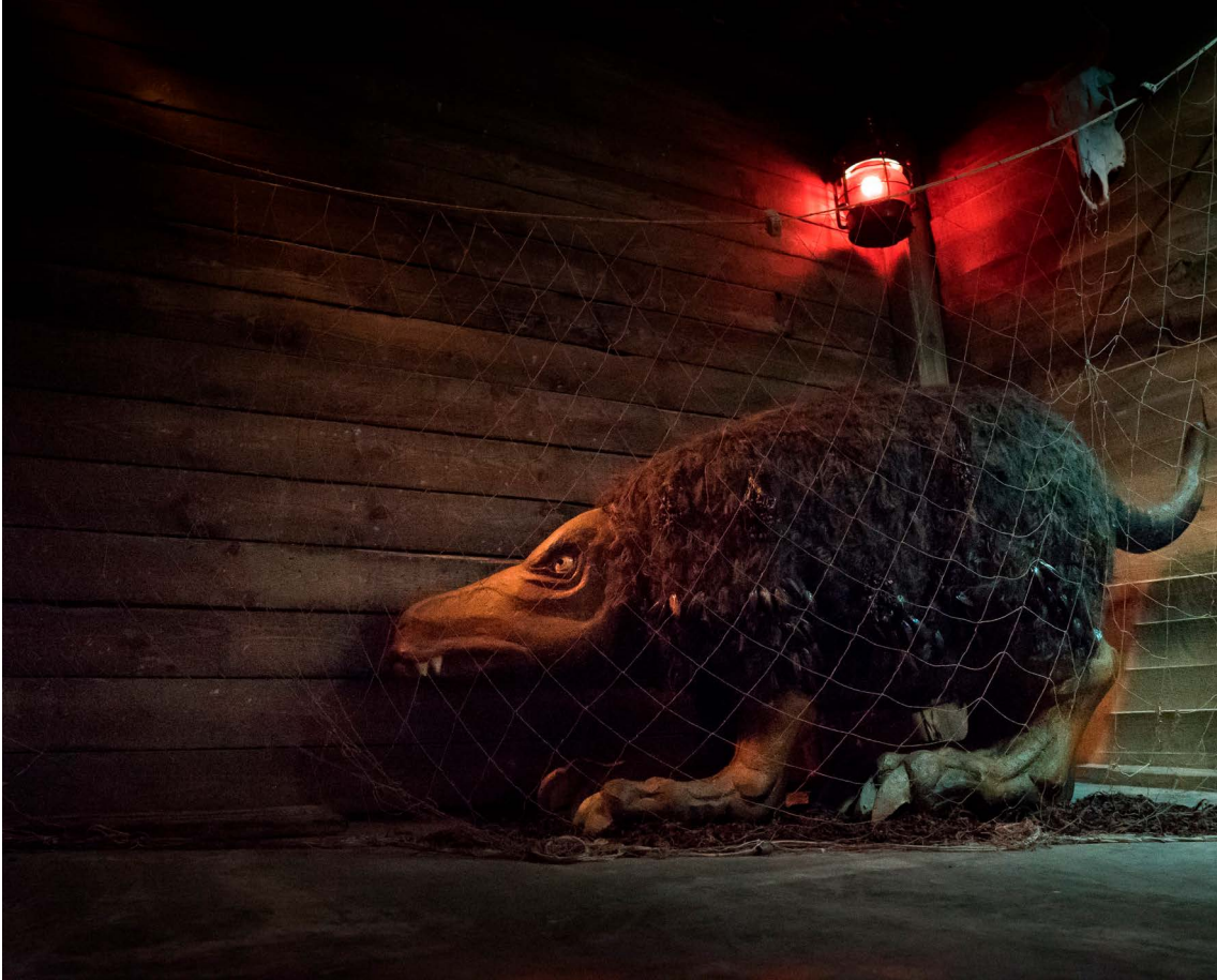
Skrímslasetrið á Bildudal