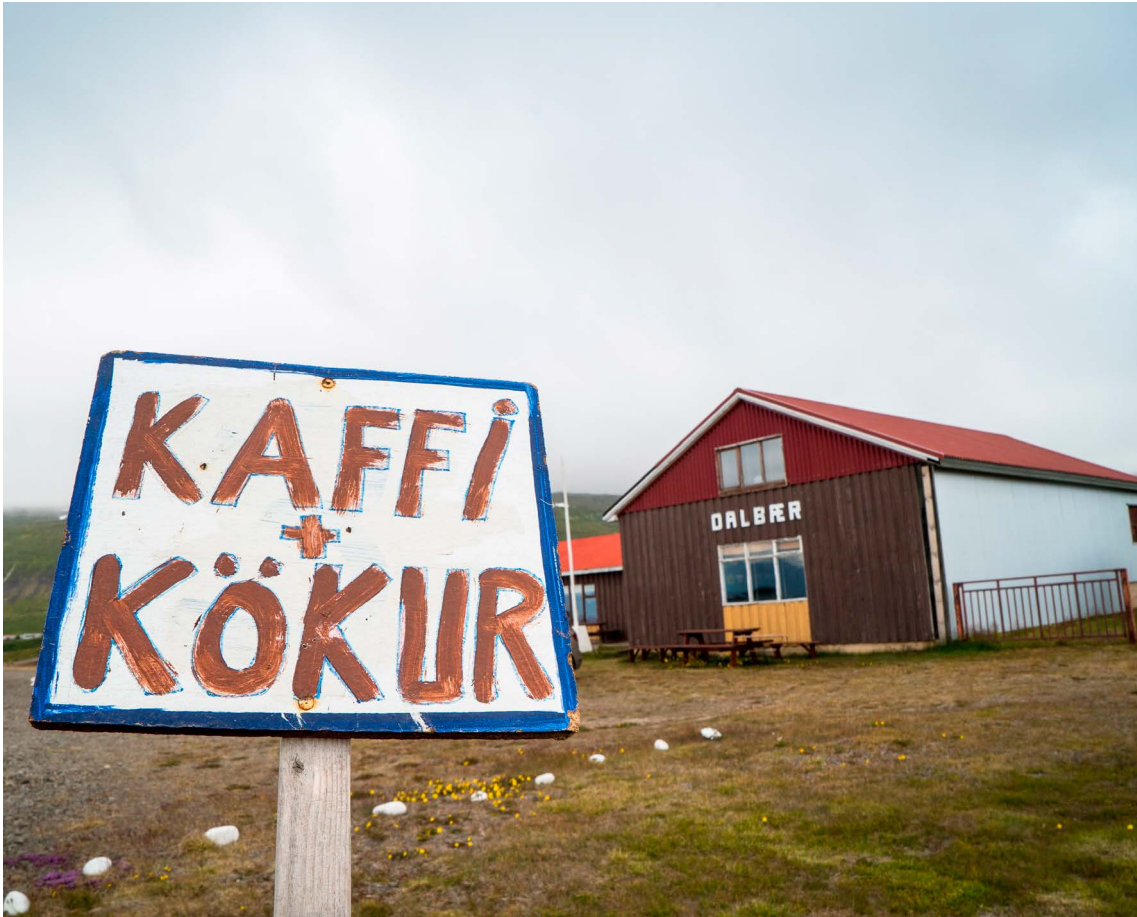
Dalbær á Snæfjallaströnd