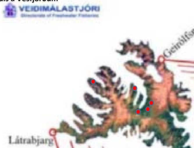
Mynd 4. Kort af laxveiðiá á áhrifasvæði laxeldis á Vestfjörðum

Ef skoðaðar eru tölur um laxveiði fyrir það svæði á Vestfjörðum þar sem laxeldi er heimilt, þá fækkar ánum nokkuð. Samtals eru fimm ár sem selja laxveiðileyfi á opinberum markaði á áhrifasvæði fiskeldis á Vestfjörðum.