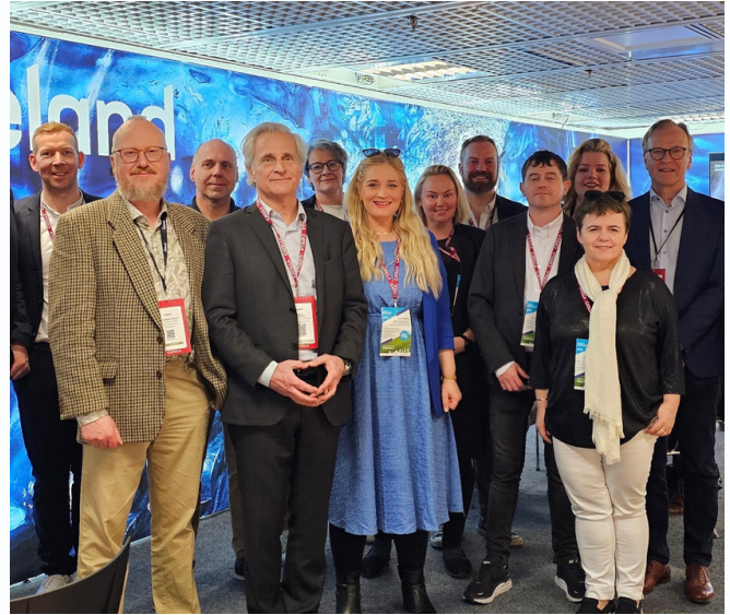
Sírý og hluti íslenska hópsins á MIPIM

Meðal þess sem íslenski hópurinn gerði í ferðinni var að heimsækja stærsta tæknigarð Evrópu, Sophia Antipolis sem er á dreifbýlissvæði rétt utan við Cannes. Garðurinn er rúmlega 50 ára gamall og segja má að frumkvöðlarnir sem stofnuðu garðinn hafi verið nokkuð á undan sinni samtíð. Garðurinn er talinn vera fyrirmynd hins svokallaða „triple helix módel“ sem gerir ráð fyrir aðkomu háskólastofnana, ríkis og atvinnulífs til að byggja upp og yfirfæra þekkingu milli rannsókna og atvinnulífs.