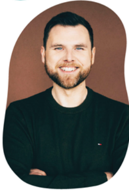
Sævar Helgi verður þingstjóri