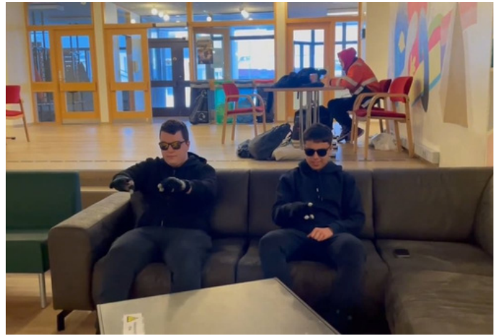
Skjaskot úr einu myndbandanna

Hér til hliðar má sjá frá afhendingu viðurkenninga og hægt er að smella á hlekkir sem leiða inn á myndböndin.